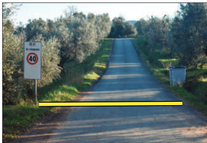
Partenza: segnale stradale SC 16 di Segalari