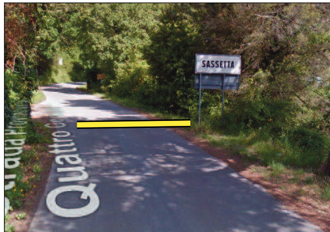
Arrivo: SP 18 al segnale di inizio località