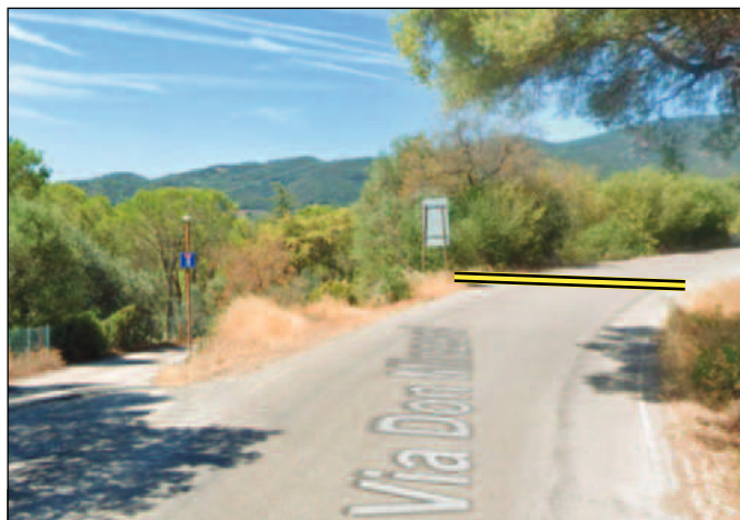
Partenza: mt. 15 dopo bivio SP Quattro Comuni - Loc. Quattrino