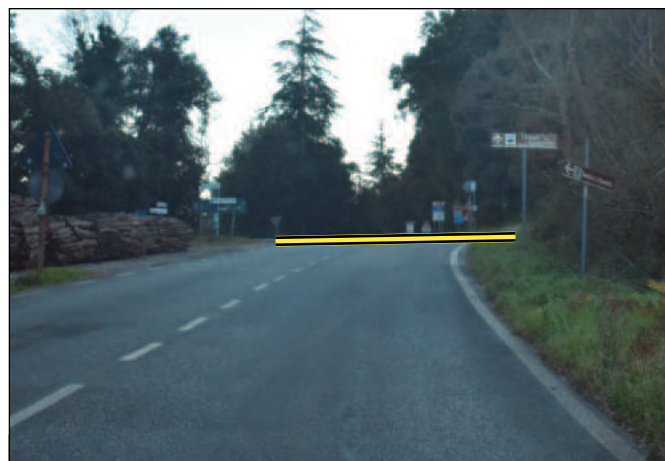
Arrivo: Sp 329 bivio per Sassetta cartello "Terme di Sassetta"